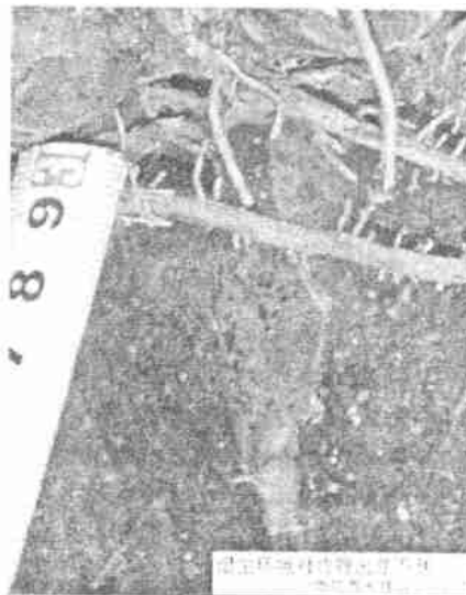
图4 湿生环境对竹鞭出芽不利

虽然竹子生长需要较多水分,有趋湿的特性,但过高的湿度会影响竹鞭的正常生长,而且竹鞭泡水后会变黑腐烂,失去繁殖能力(见图 4)。在溪流旁,水流与断面的结合更有效地阻止了毛竹林的延伸。