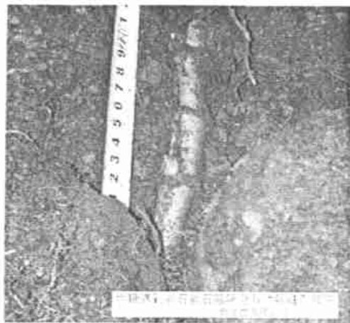
图5 竹鞭遇到岩石阻隔后的“钻缝”效应