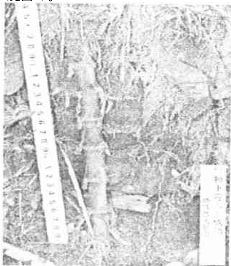
图2 竹鞭下弯入土成功

同时还发现,竹鞭在延伸中多是延地表平行扩展。对于蔓延中出土的竹鞭,可以通过下潜再次入土生长,在地表形成“跳鞭”(见图 2)。