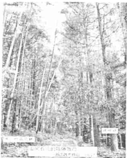
图1 山间石径的阻隔效应